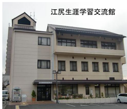
江尻生涯学習交流館

3000万署名運動を地域の民主団体と一体となって取り組んでいくことを要請します。