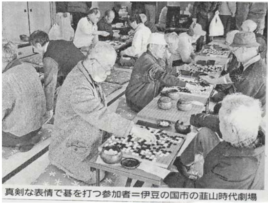
(伊豆日日新聞 2018年2月20日に掲載されました)